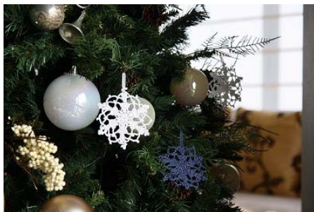
クリスマスオーナメント・クマ・コースター・アクセサリなど順次開発中