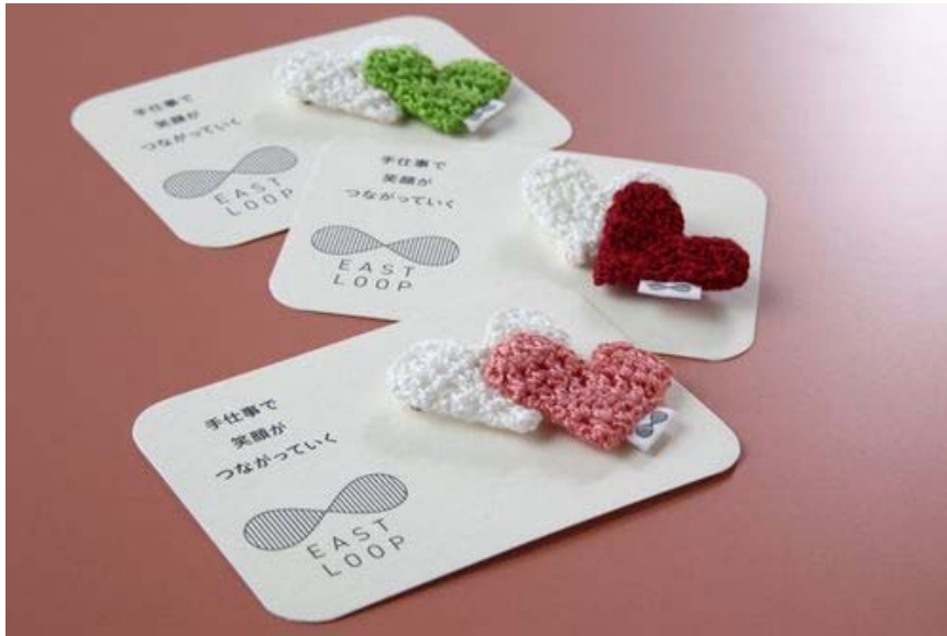
ハートブローチ 5色