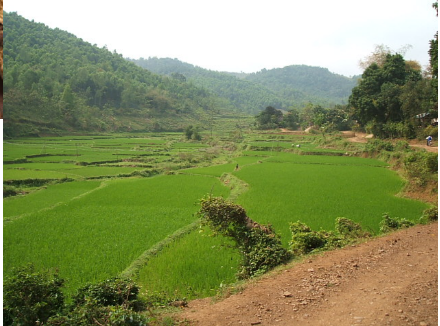
○ベトナムの農村地帯 モン族の村