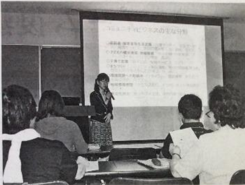
NPOや地域活性化に興味ある市民などが地域密着型事業を学ぶ笠間市のコミュニティビジネス講座。笠間市中央

笠間市は、社会貢献とビジネスが両立した持続可能な地域密着型事業を学ぶ「市コミュニティビジネス講座」を開設した。NPOや地域活性化に興味を持つ市民などを対象に、8、9月で全5回の講座を実施する。コミュニティビジネスの基礎に触れ、新事業掘り起こしなどに役立ててもらおうのが狙いだ。 同講座は、中小企業診断士などについて説明を受け、経営コンサルタントの講義や事例視察など全5回を予定し、市内のNP地域課題を事業的観点でOやボランティア団体、ま解決するコミュニティビ