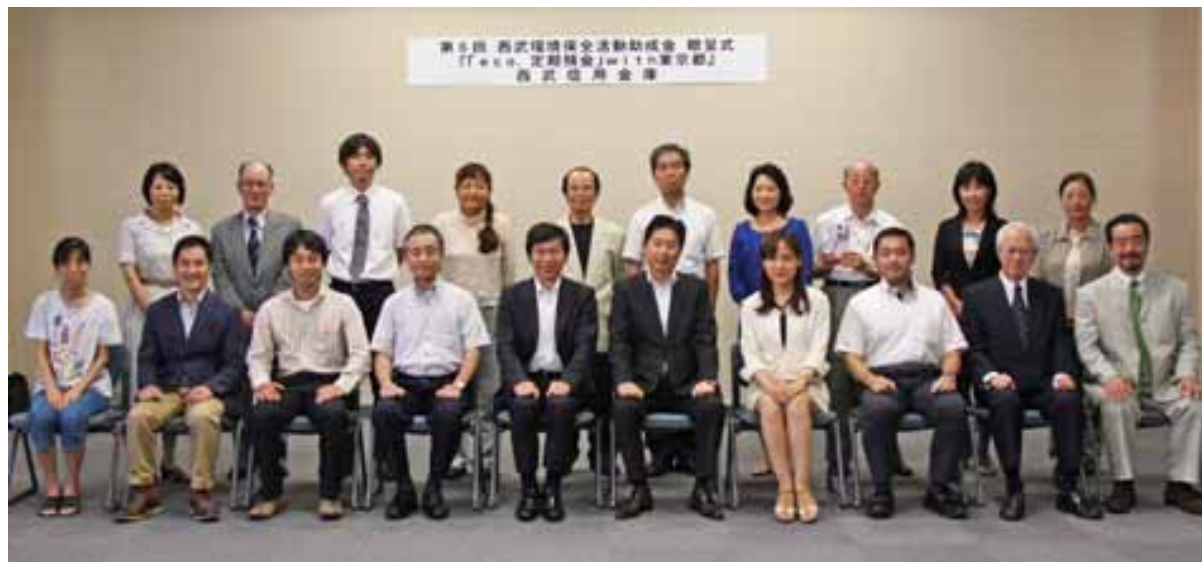
第6回助成団体の皆さま 平成24年9月贈呈