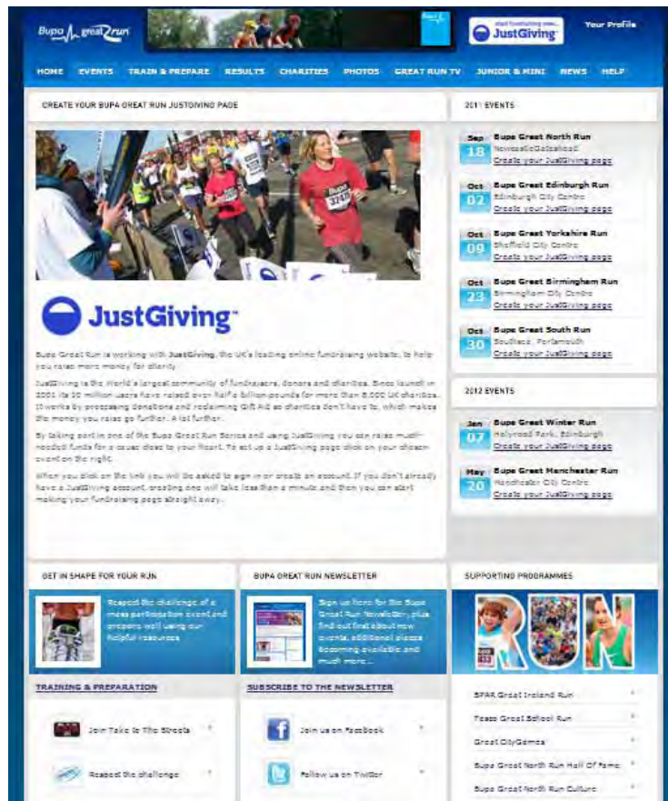
➤Bupa Great North Run

1981年以来、4.5億ポンド(607億円)、今年だけで5000万ポンド(約67億円)